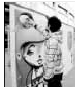
► La fiesta, ayer.