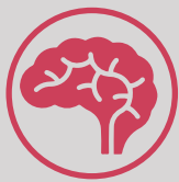
Gráfico de Habilidades

He recibido cursos de oratoria, dicción, resolución de problemas, debate y protocolo, además de canto y solfeo. Sostengo un aprendizaje continuo de nuevas y eficientes herramientas de diseño y comunicación.