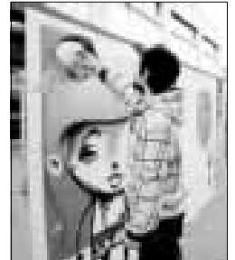
►► La fiesta, ayer.